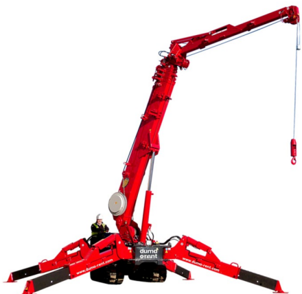
» UNIC URW-706-2